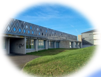
Site collège Emmanuel De Martonne

Après confirmation de la demande, une procédure d'admission est mise en place : visite, rencontre avec certains professionnels, stage.