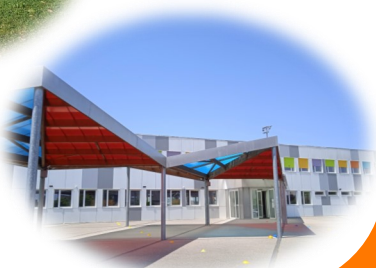
Site école Germaine Tillion