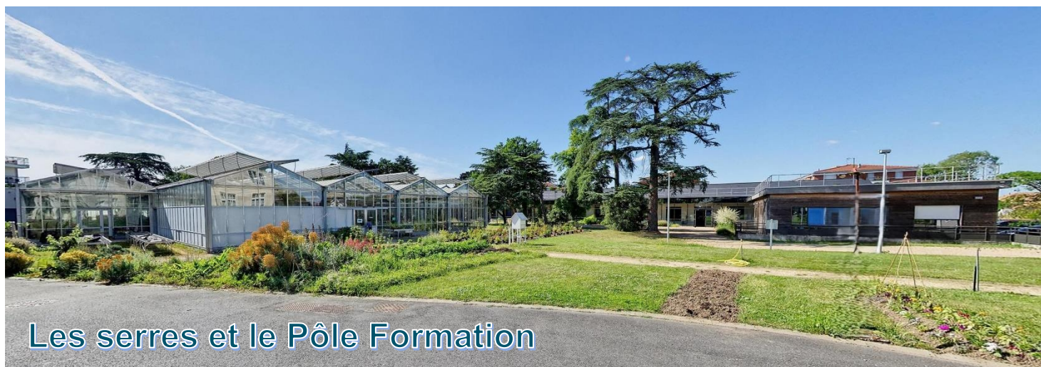
Les serres et le Pôle Formation